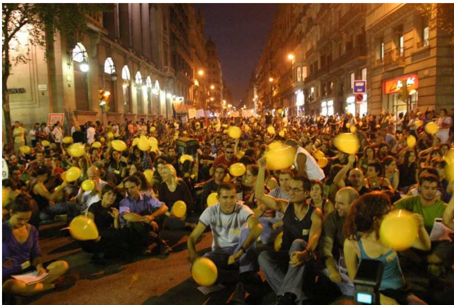
[Manifestación Barcelona por el problema de la vivienda.]

Pero es que, con lo que está cayendo,... se me antoja muy cínica la reclamación que escuche hace algunos meses de los promotores inmobiliarios a Solbes “ Hay que ayudar al sector, están en juego muchos puestos de trabajo ”. Esto me parece un chantaje de todas todas. Cuando todo iba bien... nadie se acordó de ayudar a las personas con hipoteca. Ahora que el sector va mal... los pobres hipotecados, además de ver incrementadas sus cuotas, van a salvar (con sus impuestos) a los irresponsables que se aprovecharon del boom inmobiliario.